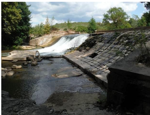
Figure 36: Le seuil de Roquefavour